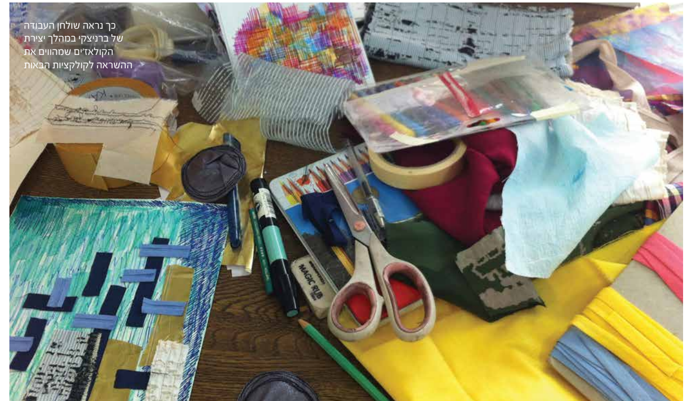
כך נראה שולחן העבודה של ברניצקי במהלך יצירת הקולאז'ים שמהווים את ההשראה לקולקציות הבאות