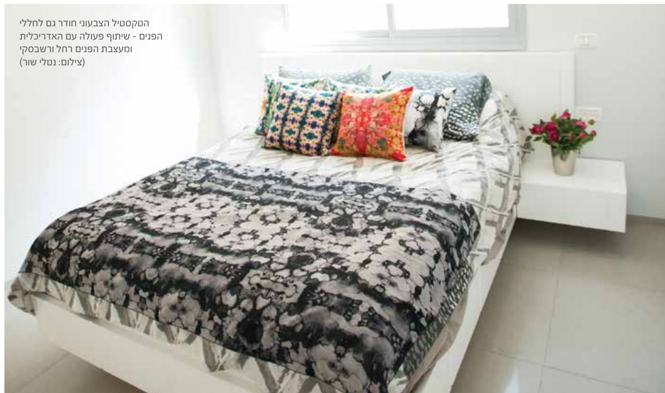
הטקסטיל הצבעוני חודר גם לחללי הפנים - שיתוף פעולה עם האדריכלית ומעצבת הפנים רחל ורשבסקי