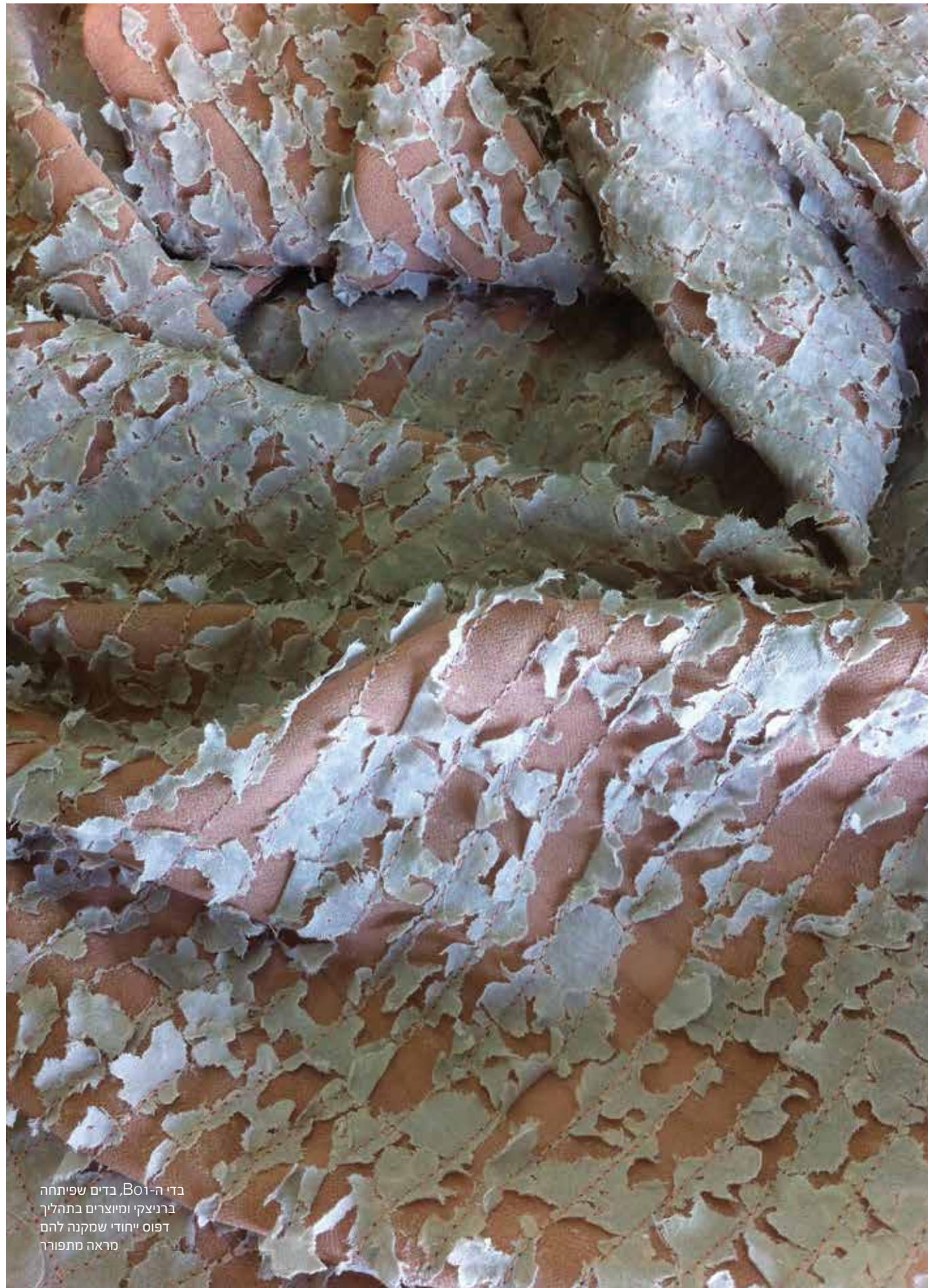
בדי ה-B01, בדים שפיתחה ברניצקי ומיצרים בתהליך דפוס ייחודי שמקנה להם מראה מתפורר